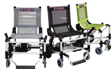
Disponible en color gris, negro y verde.